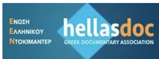
Hellas Doc - Greek Documentary Association - Greece