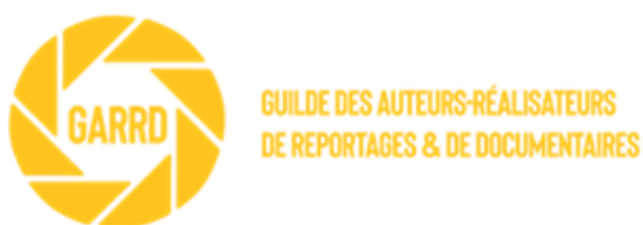
Guilde des auteurs-realiseurs de reportages & de documentaires - France