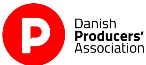
Danish Producers' Association - Denmark