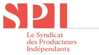
French guild of independent producers - Le Syndicat des Producteurs Indépendants - France